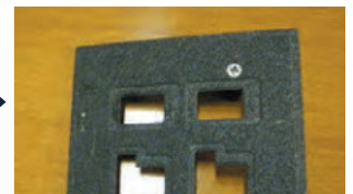
ディップパレット洗浄後