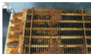
リフロー炉ヒートシンク洗浄前