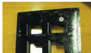
ディップパレット洗浄前