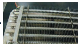
リフロー炉ヒートシンク洗浄後