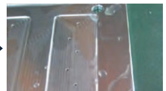
エコフラッシュα洗浄後

【詳細は仙台本社まで】ご希望の仕様や材料、お見積りなどお気軽にお問合せください！